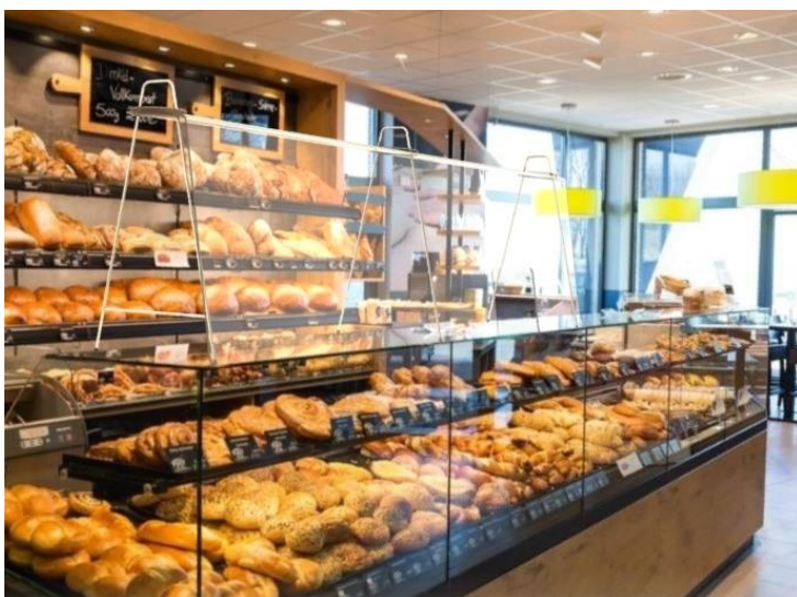
GUARD Hygieneschutz ,Counter 007'