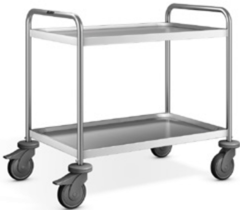
SW 8 x 5-2 Kids