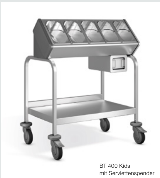
BT 400 Kids mit Serviettenspender

Er ist mit dem Speisenausgabensystem BASIC LINE Kids kombinierbar und dank erstklassiger Verarbeitung extrem langlebig.